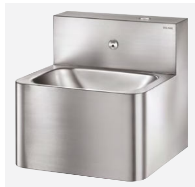
Lavabo TEK Réf. DELABIE : 161340