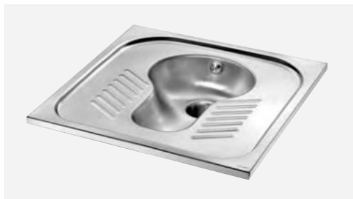
WC turc SHA 700 Réf. DELABIE : 113620

Illustrations disponibles sur notre site internet delabiebelux.com , rubrique Presse