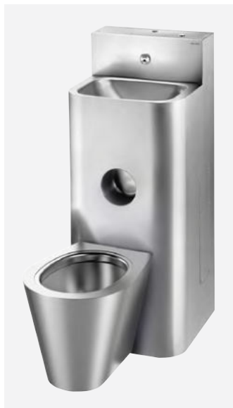
Combi KOMPACT Réf. DELABIE : 160800