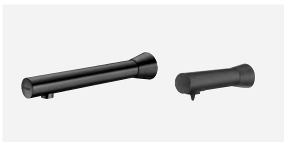
Robinet de lavabo automatique noir mural BLACK BINOPTIC 2 et distributeur de savon noir mural BINOPTIC Réfs. DELABIE : 384130, 512051BK