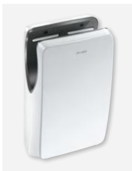
Mat wit DELABIE ref.: 510624W