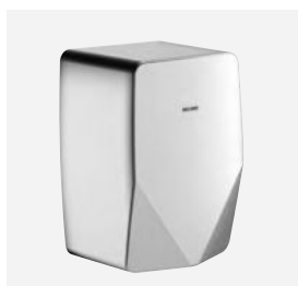
Mat gepolijst rvs DELABIE ref.: 510625S