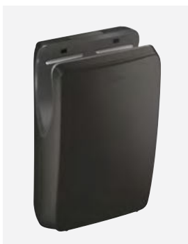
Mat zwart DELABIE ref.: 510624B