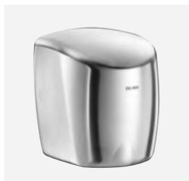
Mat gepolijst rvs DELABIE ref.: 510622S