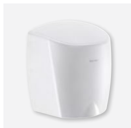
Wit geëpoxeerd rvs DELABIE ref.: 510622W