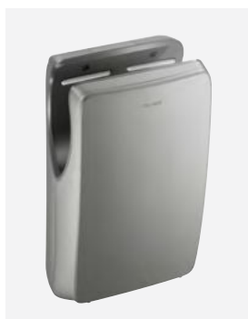
Antraciet grijs DELABIE ref.: 510624C