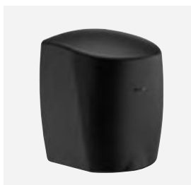
Mat zwart geëpoxeerd rvs DELABIE ref.: 510622BK