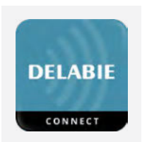
Enkele BINOPTIC 2 modellen zijn instelbaar via Bluetooth®