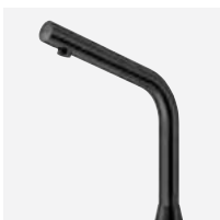
Mat zwarte afwerking H. 250 mm