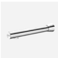
Verchromd wandmodel L. 220 mm