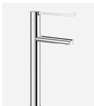
Vaste uitloop H.300 L.160 Ref. DELABIE: 2665T3BEL