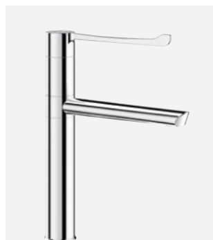
Draaibare uitloop H.200 L.200 Ref. DELABIE: 2664T5BEL