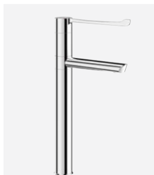
Draaibare uitloop H.300 L.160 Ref. DELABIE: 2664T3BEL