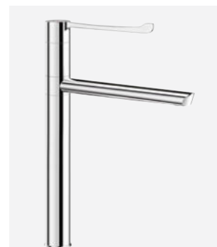
Draaibare uitloop H.300 L.250 Ref. DELABIE: 2664T4BEL