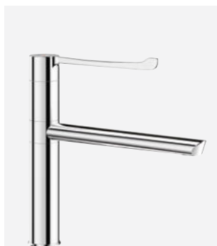
Draaibare uitloop H.160 L.250 Ref. DELABIE: 2664T2BEL

Afbeeldingen zijn beschikbaar op de website delabiebelux.com , rubriek Pers