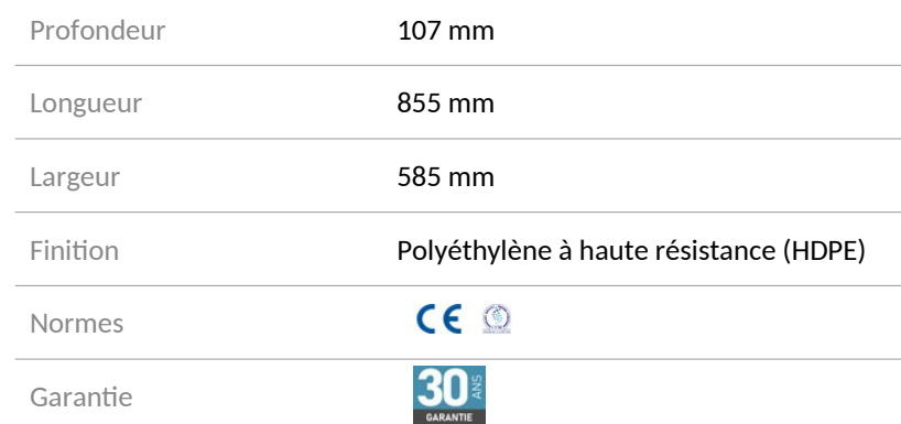
Table à langer - Réf. 510700