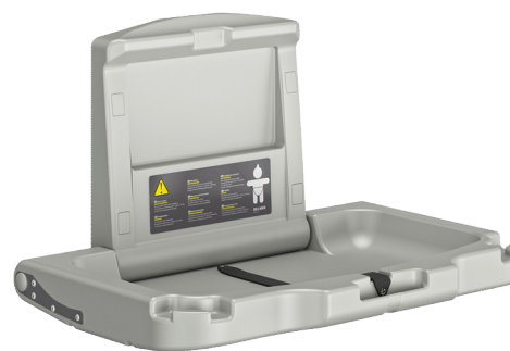
Table à langer murale